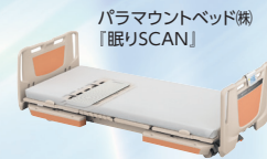
パラマウントベッド株式会社 「眠りSCAN」