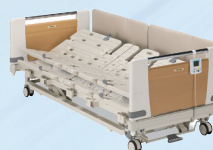
フランスベッド株式会社 「自動寝返り支援ベッド」