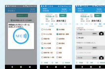
株式会社 「Care-wing 介護の翼」